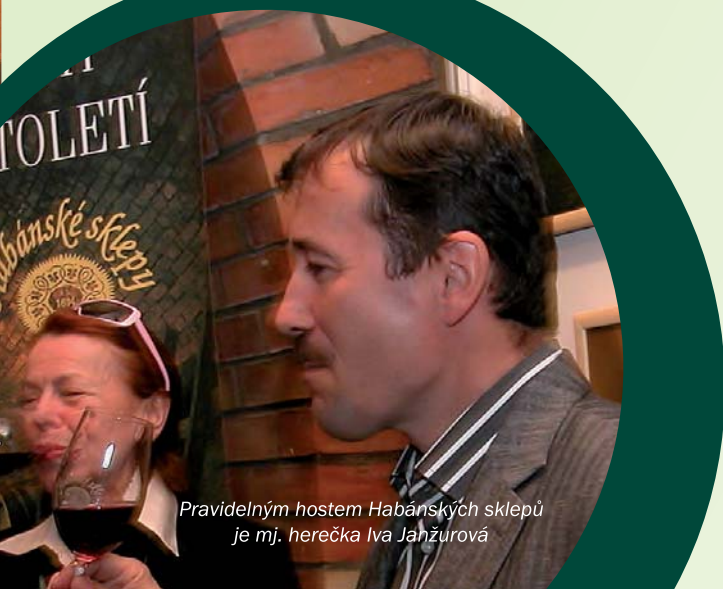
Pravidelným hostem Habánských sklepů je mj. herečka Iva Janžurová